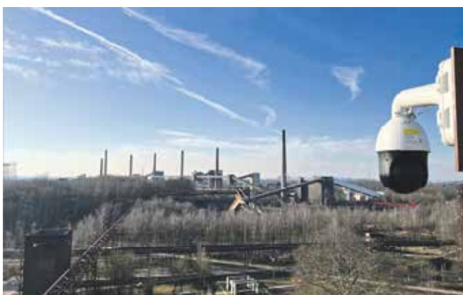
Sonnige Aussichten beim Blick auf die Kokerei Zollverein.

100 Hektar große Gelände: vom Doppelbock über die Kohlenwäsche, den Zollverein-Park und die Kokerei bis zu PACT Zollverein auf der Schachanlage 1/2/8. „In den Bergen, an der See, mit Blick auf bekannte Sehenswürdigkeiten – und jetzt auf einem UNESCO-Welterbe: Ich freue mich, dass unsere Gäste genauso wie alle anderen Interessierten nun die Möglichkeit haben, Zollverein das ganze Jahr lang aus der Vogelperspektive und im Wandel der Jahreszeiten zu ‚besuchen‘“, sagt Prof. Dr. Hans-Peter Noll, Vorstandsvorsitzender der Stiftung Zollverein. Bisher hat wetter.com das Wetter ausschließlich live vom Ruhrturm übertragen – nun ist auch Zollverein als „Wetterfrosch“ aktiv.