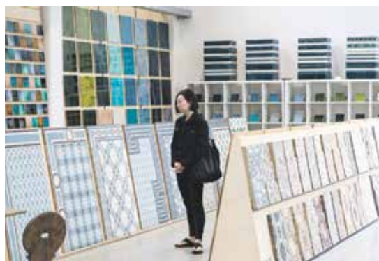
Fliesen in Hülle und Fülle: im Showroom von GOLEM Kunst- und Baukeramik.