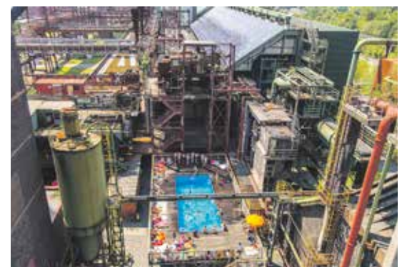
Wieder während der Sommerferien geöffnet: das strahlend blaue Werksschwimmbad.