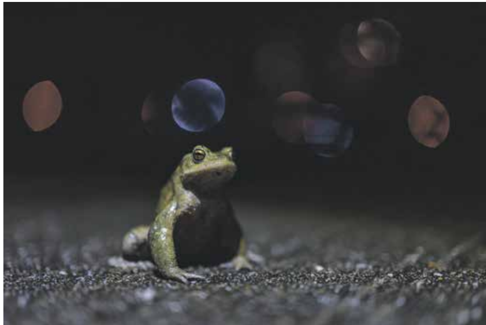
Freiwillige helfen den Kröten, Fröschen und Molchen, sicher von der einen auf die andere Straßenseite zu gelangen.

Während der Hausrotschwanz noch die Sonne im Mittelmeerraum genießt und die Fledermäuse im Winterschlaf schlummern, wachen die ersten tierischen Zollverein-Bewohner aus ihrer Winterstarre auf. Erdkröten und Molche kommen aus ihren Verstecken wie Laubhaufen, Erdlöchern, Baumwurzeln und Totholz hervor. Sie sind wechselwarme Amphibien; heißt: Ihre Körpertemperatur hängt von der Außentemperatur ab und passt sich entsprechend daran. Erst einmal aktiv geworden, wollen sie schnellstmöglich für Nachwuchs sorgen. Dafür wandern die Kröten, Frösche und Molche über das Gelände zu geeigneten Wasserstellen, die sich rund um den Portalkratzer zwischen Zeche und Kokerei befinden. Ihr Weg führt die Amphibien aus ihren sicheren Winterquartieren auf der Halde über die für sie sehr unsichere Straße der Fritz-Schupp-Allee. Um den Tieren bei der Überquerung des gefährlichen Asphalts zu helfen, hat die Stiftung Zollverein in Kooperation