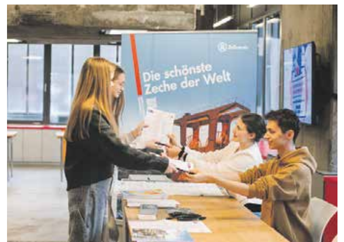
Bei der U18-Bundestagswahl konnten junge Menschen ihrer Stimme Ausdruck verleihen.

Veranstaltung wird um 19 Uhr in Halle 6 stattfinden und ist kostenfrei.