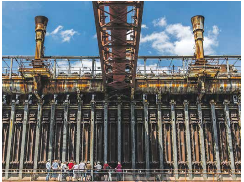
Imposantes Äußeres, komplexes Inneres: Während einer Führung erfahren Interessierte Wissenswertes über die Funktionsabläufe der Kokerei Zollverein.

25.000 Exponate auf 1.500 Quadratmetern: In seinem Zentral- und Schaudepot lagert und präsentiert das Ruhr Museum faszinierende Stücke aus seinen Geologischen, Archäologischen und Historischen Sammlungen. Während einer Führung streifen Besucherinnen und Besucher durch über 110 Jahre Sammlungsgeschichte, lernen Schlüsselobjekte kennen und werfen gleichzeitig einen Blick hinter die Kulissen eines Regionalmuseums. Da das Depot keine klassischen Ausstellungen zu einem bestimmten Thema zeigt, besitzt es eine andere Dynamik als ein Museum. Es dient als umfassender Speicher für zukünftige Ausstellungsprojekte zur Geschichte der Region und veranschaulicht auf beeindruckende Weise die Substanz, Größe und Vielfalt der drei Sammlungen ebenso wie die drei Hauptaufgaben eines Museums: Sammeln, Bewahren und Erforschen. Das Schaudepot ist in der ehemaligen Salzfabrik beheimatet. Bis zur Stilllegung der Kokerei wurden hier die beim Verkokungsprozess anfallenden Nebenprodukte von der stetig wachsenden Industrie in großem Maße weiterverwertet, darunter Ammoniak und Schwefelsäure als Grundstoffe für Salz.