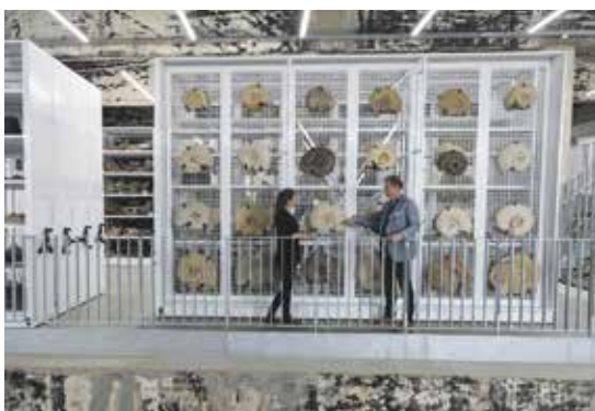
Einblick in die Schatzkammer des Ruhrgebiets: das Schaudepot des Ruhr Museums.