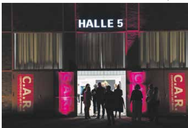
Welche neuen Kunstwerke werden in der Frühjahrsausgabe der C.A.R. zu sehen sein?