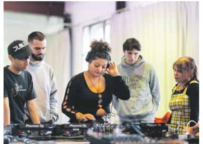
Junge Musikbegeisterte können sich bei „SOUND ON“ ausleben.