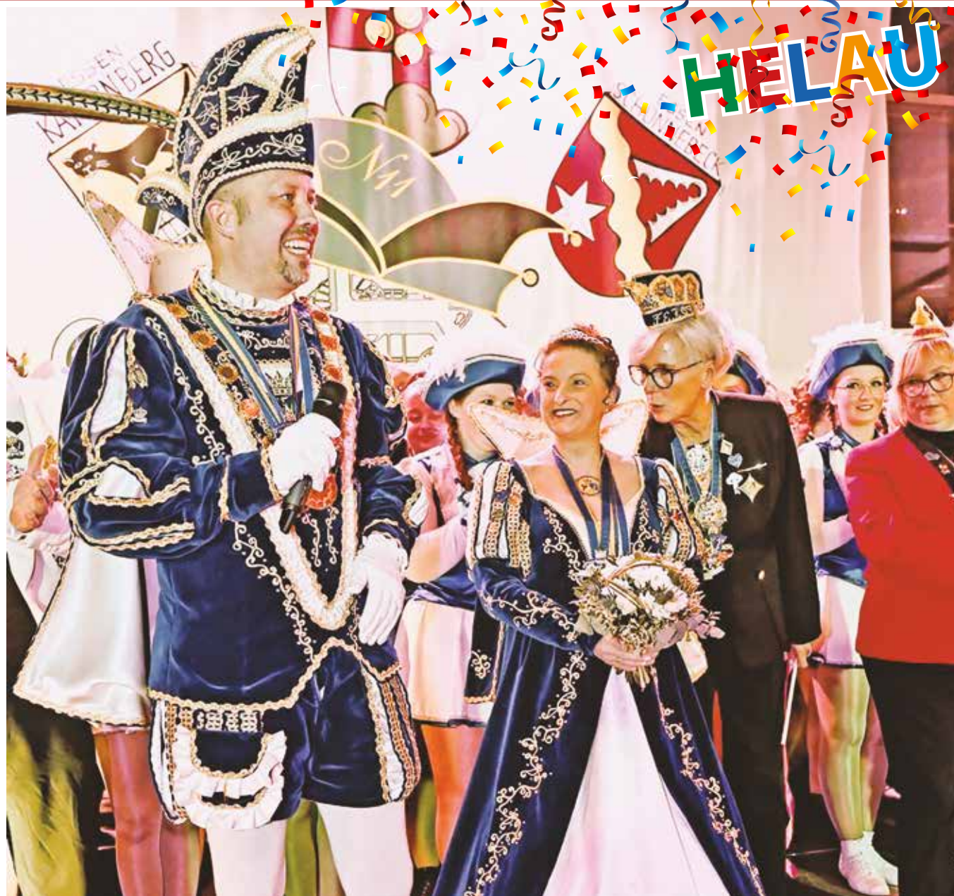
Das Essener Prinzenpaar seine Tollität Prinz HaPe I. und ihre Lieblichkeit Prinzessin Assindia Denise I. ▶ Weiter geht es auf Seite 2 Anzeigen